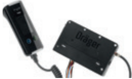
Käsiosa ja keskusyksikkö Interlock® 7000