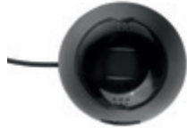
Kamera Interlock® 7000