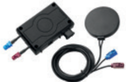
GPRS moduuli Interlock® 7000